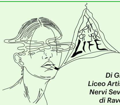
Di Giulia, Liceo Artistico Nervi Severini di Ravenna

Tra queste, ad esempio, lo superare i limiti o adottare una velocità rischiosa, ovvero non consona al contesto stradale del momento (stato della strada, traffico, visibilità e altre condizioni, tra cui quelle meteorologiche, ecc.).